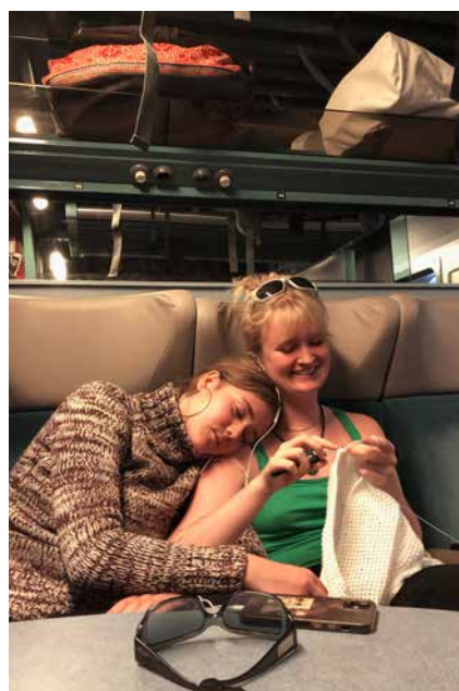
Tog med kupeer er bare det bedste. Især med hækletøj og en lille lur.